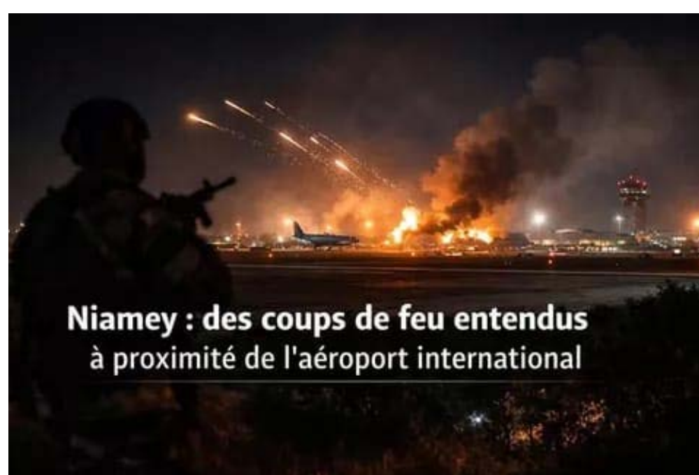
Niamey : des coups de feu entendus à proximité de l'aéroport international

La violence des détonations a provoqué un mouvement de panique à l'intérieur et aux alentours de l'aéroport. Des passagers, pris de peur, ont quitté les lieux à pied, tandis que plu-